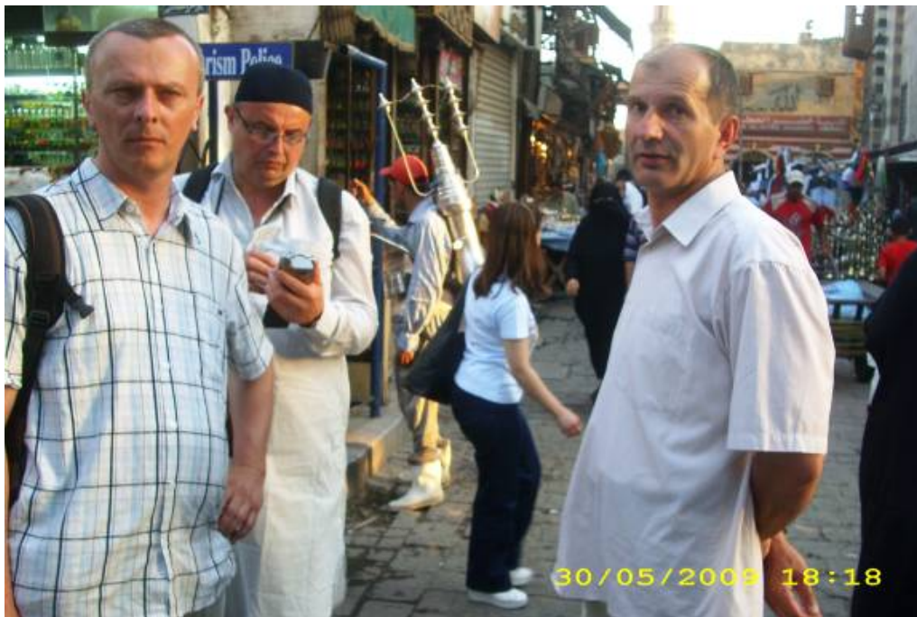
Sa Suadom i Zajkom na Khan El Khalili bazaru

Pod utiskom događaja u Al Azharu ušli smo u Khan El Khalili bazar. Davno sam čuo da je to najbolje mjesto za kupovinu u cijelome svijetu. Ne znam koliko je to tačno, ali ako se zanemare nametljivi trgovci onda se tu doista mogu pronaći mnoge lijepe stvari. Ovoga puta sam ugledao malu prodavnicu u kojoj se prodaju biseri. Upitao sam trgovca koje sve boje bisera ima na što je ponudio da me odvede u obližnju veću prodavnicu koja je također u njegovome vlasništvu. Pristali smo i na samo 50- ak metara udaljenosti uveo nas je u veličanstvenu prodavnicu na tri sprata. To nije bila samo prodavnica već i manufaktura u kojoj su se ručno oblikovale razne vrste kamena za izradu nakita i tespiha. Cijela porodica je radila na izradi nakita. Ovdje smo ostali nekoliko sati jer smo imali najrazličitije želje u pogledu dužine i izgleda nakita, koje su vješte ruke pred našim očima pretvarale u djelo. Ovdje sam pronašao i sive bisere kakve nisam vidio ni u Medini.