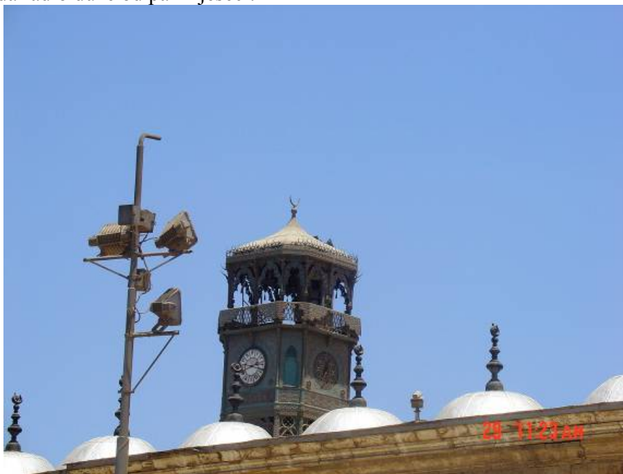
„Francuska“ sahat kula uz džamiju Muhameda Alije

Sa Citadele se pruža pogled na cijeli Kairo. Kako se Kairo nalazi usred pustinje i veoma često puše vjetar koji podiže pustinjski pijesak, onda je i vidljivost obično smanjena. Taj pijesak je razlog što u Kairu gotovo nema sahat kula, jer pijesak vrlo brzo zaustavlja mehanizam sata ma kako dobro on bio zaštićen. Jedna od rijetkih sahat kula se nalazi upravo ovdje na Citadeli uz džamiju Muhameda Alije, a koju je neki Francuz mijenjao za drevni obelisk iz Louxora. Obelisk se danas nalazi u Parizu a ovaj sat kako sam saznao nije nikada radio duže od par mjeseci.