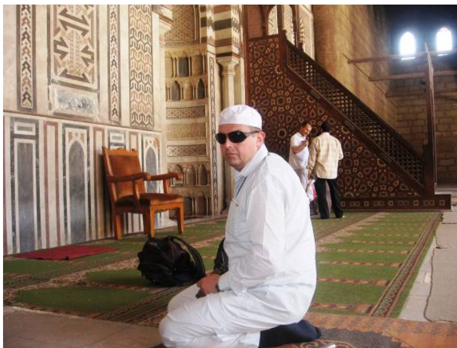
U džamiji Al Nasir Muhamed

Vojnim muzejom dominira bista Jusuf Paše jednog od najvećih egipatskih vojskovođa. Muzej se nalazi na otvorenome prostoru i u njemu se mogu vidjeti brojni eksponati oruđa i oružja uključujući i borbene avione.