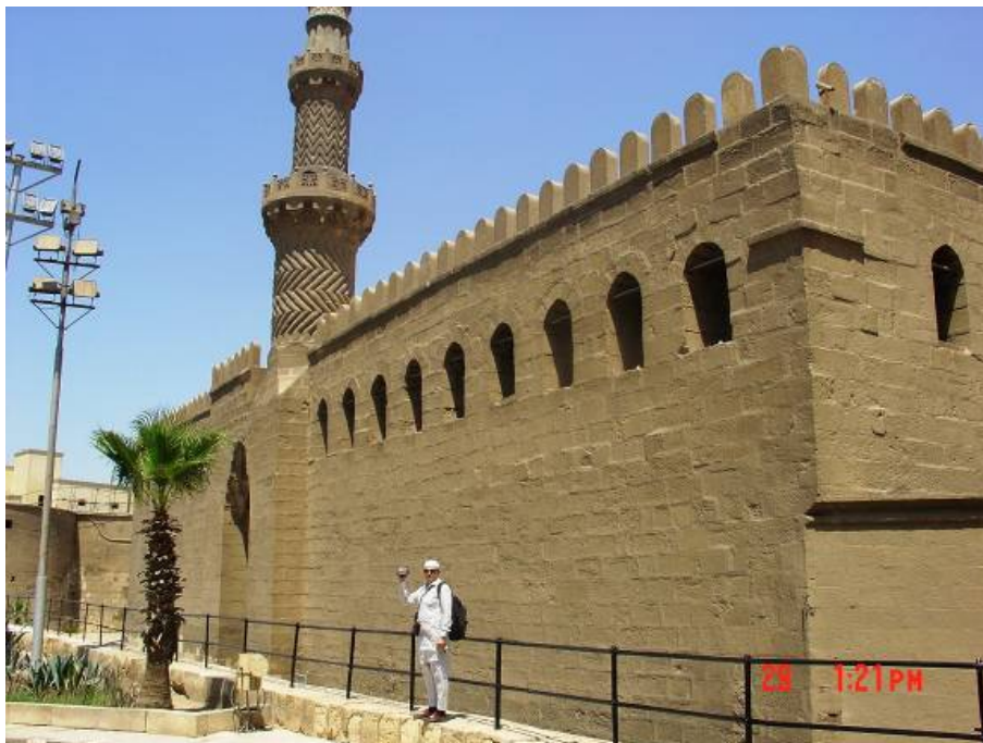
Džamija Al Nasir Muhamed