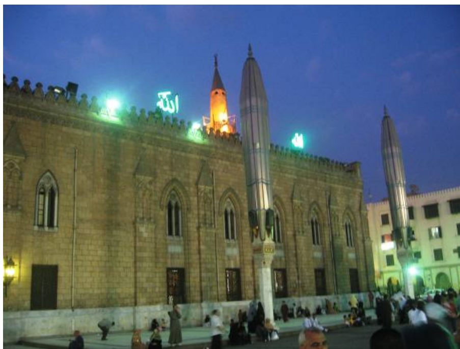
Džamija El Husein

Nakon akšam namaza malo smo prošetali Khan El Khalilijem, gdje vas hiljade trgovaca pokušava animirati da kupite baš kod njega. Ova pojava nije vezana samo za trgovine već čak i za čajdžinice, pa dok prolazite svi pokušavaju da vas uvuku baš u svoju čajdžinicu. Nekada mi se čini da to ima potpuno suprotan efekat od onoga što bi oni željeli, pa nekada čak i kada bi ste ušli da se osvježite, takav njihov agresivan pristup vas odbije. Ipak smo sjeli u jednu čajdžinicu uz samu džamiju Al Husein i osvježili se sokom. Naravno cijene u ovoj čajdžinici su bile puno skuplje nego u nekom drugome dijelu Kaira, ali ugođaj u kojem ispred sebe gledate u džamiju El Husein, a onda se okrenete samo malo udesno i vidite Al Azhar se može doživjeti samo ovdje. U džamiji El Husein smo klanjali i jaciju a onda smo uzeli taksi i vratili se u hotel.