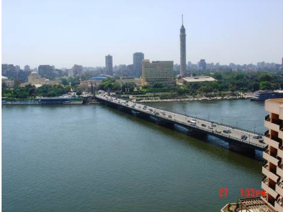
Pogled iz moje sobe hotela Semiramis Interkontinental na Kairo

Prvi dan u Kairu je počeo sa obilnim doručkom u jednome od brojnih hotelskih restorana a onda je nastavljen obaveznim upoznavanjem sa učesnicima seminara. Bila je srijeda a saznali smo i da će se ceremonija dodjele nagrada održati u četvrtak ujutro. Predviđeno je da se svaki dobitnik obrati skupu i uz Power Point prezentaciju prikaže svoj projekat. Suad i ja smo se već ranije odlučili da za naš projekat ne pravimo prezentaciju već smo snimili 10 minutni film. Za film smo koristili materijale snimljene za vrijeme implementacije projekta, ali smo isto tako prethodnih dana snimili izjave od načelnika Konjica Emira Bubala i građana Konjica. Sav tekst smo preveli na engleski, a onda je moja kolegica Selma Osmanagić Klico pročitala taj tekst i to smo sinhronizirali.