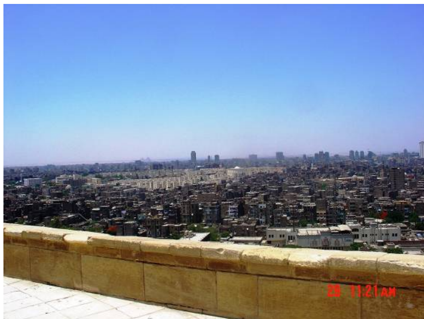
Pogled sa Citadele na Kairo

Sa Citadele se pruža pogled na cijeli Kairo. Kako se Kairo nalazi usred pustinje i veoma često puše vjetar koji podiže pustinjski pijesak, onda je i vidljivost obično smanjena. Taj pijesak je razlog što u Kairu gotovo nema sahat kula, jer pijesak vrlo brzo zaustavlja mehanizam sata ma kako dobro on bio zaštićen. Jedna od rijetkih sahat kula se nalazi upravo ovdje na Citadeli uz džamiju Muhameda Alije, a koju je neki Francuz mijenjao za drevni obelisk iz Louxora. Obelisk se danas nalazi u Parizu a ovaj sat kako sam saznao nije nikada radio duže od par mjeseci.