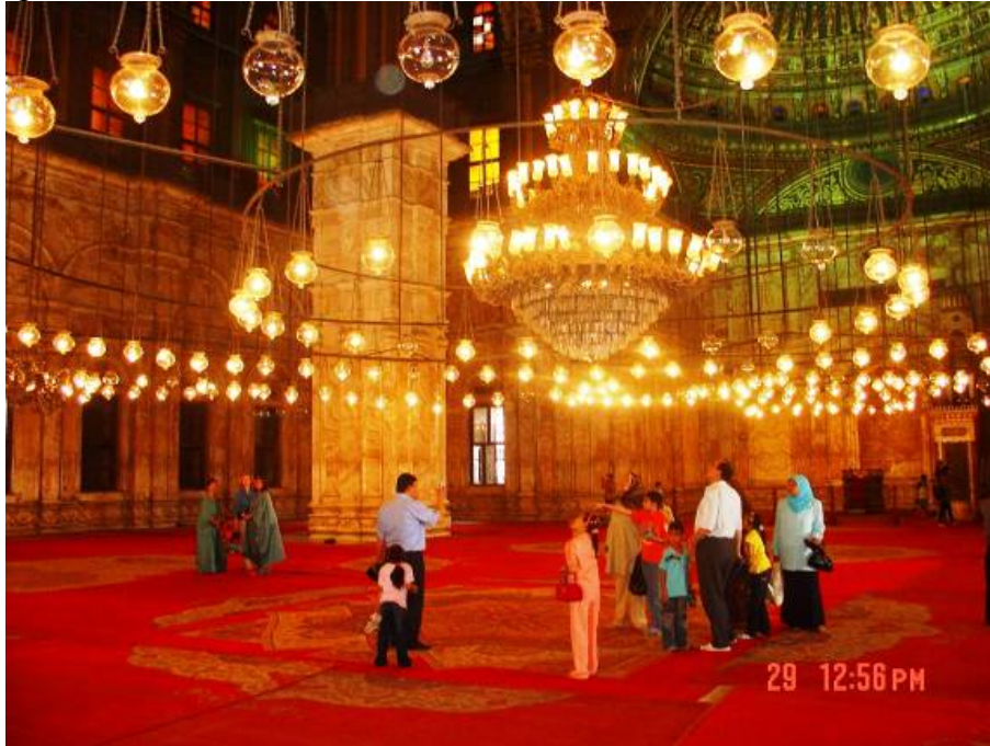
U džamiji Muhameda Alije

I ovdje u Kairu imam je vazio više od sat vremena. Čak je napravio i jednu pauzu, a potom je klanjao dva rekeata džume. Za mene je zbnjujuće bio što je u prvome rekeatu klanjao suru 112 El Ihlas a u drugome suru 114 El Nas, preskaćući jednu suru a što mi smatramo pokuđenim.