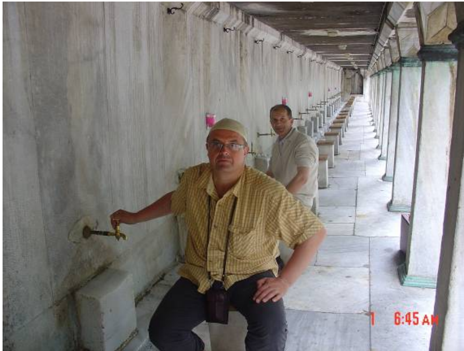
Abdestana u Sultan Ahmetovoj džamiji u Istanbulu

Nas trojica smo sjeli na metro odmah na aerodromu i na stanici Zeytinburnu presjeli u moderni tramvaj. Nakon pola sata izašli smo u Sultan Ahmetu. Uzeli smo abdest i ušli u Sultan Ahmetovu (Plavu džamiju).