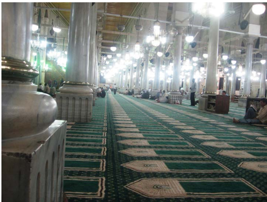
u džamiji El Husein

Krenuli smo prema taksiju. Zajko reče da bi volio da ponovo sretnemo „taksistu magistra“ na što sam mu odgovorio da bi među ovolikim brojem taksija to bilo doista nevjerovatno. Dragi Allah je svemoguć, tako da smo mi već sa nekih 50-ak metar vidjeli našeg taksistu kako stoji baš kao da nas čeka. Na povratku smo se dogovorili sa njim da nas on sutra u ponoć prebaci svojim taksijem do aerodroma. Njegovo vozilo je fiat 125 PZ iz 71. ili 72. godine koji nema niti jedno bočno staklo. Rekao je da će za tu vožnju od svoga punca pozajmiti bolje vozilo jer se aerodrom nalazi na oko 20 km od Kaira.