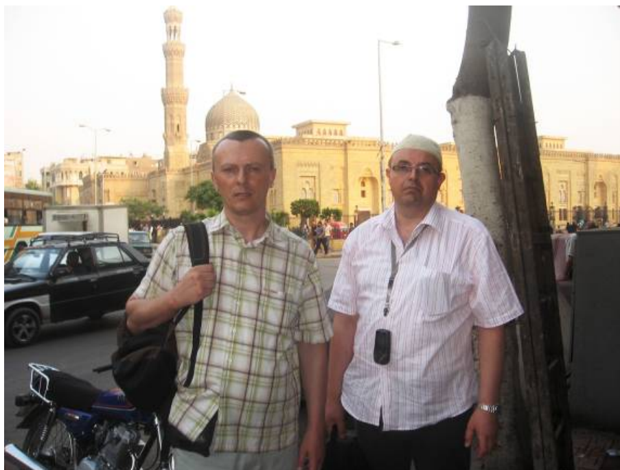
Džamija Zayneb Seidina