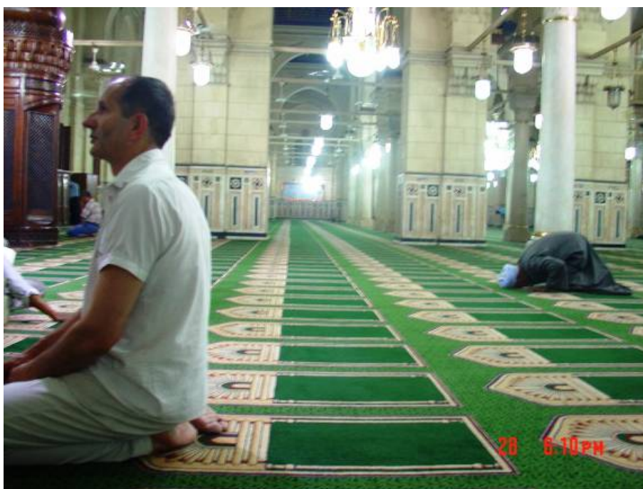
Zajko u džamiji Zayneb Seidina

U petak 29.06.2009. smo se odjavili u hotelu Interkontinental i uzeli taksi kojim ćemo se prebaciti do hotela „Pharaoh“. Prosječna starost taksija u Kairu je između 30 i 40 godina. Uglavnom su to vozila Fiat 1300, PZ i neki od tipova Lade. Za transport do hotela smo našli jedan Peugeot 404 karavan, dovoljno velik da bi smo mogli smjestiti sve stvari i sjesti nas četvorica. Vozač