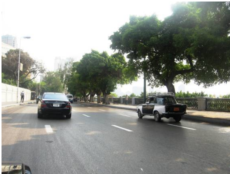
Suprotnosti na ulicama. najnoviji Mercedes uz „tristać“ star 40 godina

Kada se nalazim na putovanjima onda ne želim da gubim vrijeme i ne osjećam umor. Kako kaže naš dragi hafiz Bugari: „duša mi se ne umara a tijelo je svakako prašina“, tako i ja moram biti u pokretu i posjetiti što više znamenitih mjesta, jer svaki trenutak proveden u hotelskoj sobi smatram nepovratno izgubljenim.