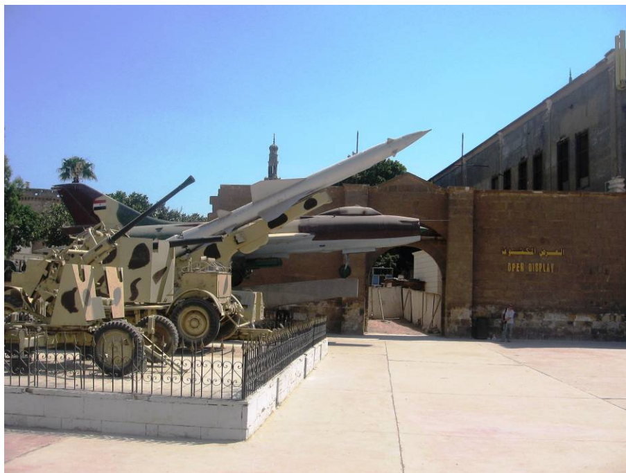
Vojni muzej u Citadeli

Sunce je neumorno pržilo pa smo se po napuštanju muzeja osvježili u jednome kafiću u krugu Citadele, a onda smo odlučili da se vratimo na ručak u hotelski restoran. Taksisti koji smo uzeli da nas odveze do hotela je bio prosto nevjerojatan. Osim što se radi o vozilu Fiat 125 PZ vjerojatno iz 1971. godine, vozilo je bilo u nevjerojatnome stanju. Taksista ga je upalio spajanjem nekih kablova ispod volana. Kada ga je napokon upalio prema zvuku motora moglo se zaključiti da u motoru rade samo tri cilindra. U stvari kada se sve sagleda nije čudo to što nije radio četvrti cilindar, već je čudo što su uopće radila ova tri. Prošli smo pored džamije „Sejda Aiša“, rimskog akvadukta, grada mrtvih i nakon pola sata živi i zdravi stigli u hotel.