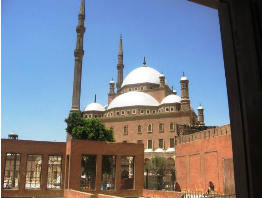
Džamija Muhameda Alije

Ušli smo u džamiju Muhameda Alije baš u momentu kada su čuvari tjerali turiste da napuste prostor džamije, jer se približavalo vrijeme namaza. Jedan od čuvara je prišao i nama misleći da smo turisti. Kada smo u rekli da hoćemo da klanjamo džumu upitao nas je zbunjeno jesmo li muslimani. Na naš potvrđan odgovor, samo je rekao Elhamdulillah i otišao od nas. Džamiju je projektovao i sagradio jedan grčki arhitekta. Gradnja je počela 1830, a završila se 1857. godine. Mnogi dijelovi džamije obloženi su alabasterom, materijalom nalik bijelom mermeru, pa odatle potiče i dugi naziv za ovu džamiju „Alabaster džamija“. Džamija je specifična i po tome što se cipele skidaju pri ulasku u harem džamije kako bi se sačuvao alabaster od oštećenja. Unutar alabasterom popločanog dvorišta ispred džamije, nalazi se prelijepa fontana. Centralna kupola džamije je visoka 50 metara i okružena je sa više manjih polu-kupola. Sa svake strane kupole nalaze se minareti, visoki skoro 90 metara.